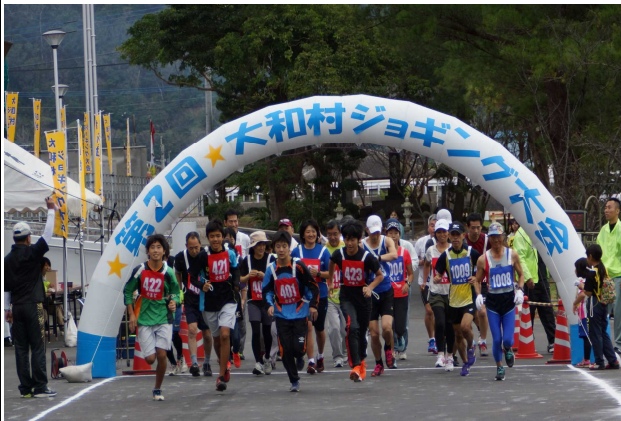
(4キロ・10キロの部スタート!)

平成27年11月29日(日)に、第2回大和村ジョギング大会が大和村体育館から大和ダム周辺の村道にて開催されました。2キロ・4キロ・10キロの3コースに118名の方がエントリーされました。今回は村外からも参加があり、ジョギング人気浸透しつつあります。大会を機に健康増進、体力の向上のためにも、運動を心がけてみてはいかがでしょうか。