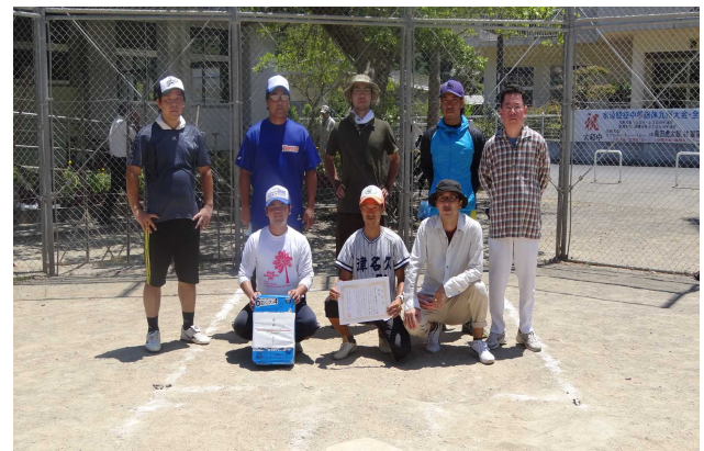
(津名久・思勝 合同チーム)

8月11日（日）に、大和小・大和中グラウンドにて、第56回スローピッチソフトボール大会が開催されました。村内から6チームが参加し熱戦が繰り広げられました。炎天下の中、各集落の代表選手ハツラツとしたプレーを展開し、決勝戦は、津名久・思勝合同チームが国直チームに勝利し、優勝の栄冠を勝ち取りました。