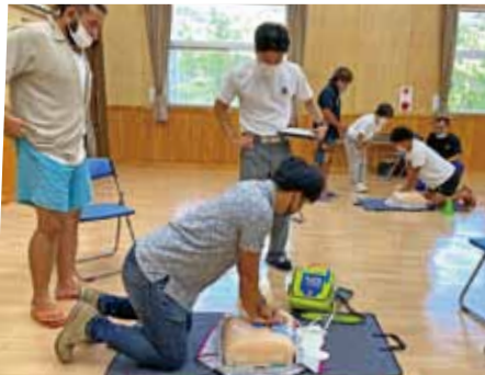
さまざまな場面を想定して心肺蘇生法を行いました

大和村集体落まるごと体験協議会では、夏休みを直前に控えた7月12日に、体験観光事業者や宿泊事業者を中心とした「上級救命講習会」を行いました。