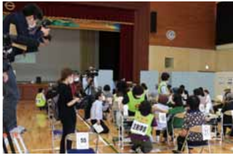
集団接種初日の様子

大和村におきましては、新型コロナウイルス感染症対策として、4月よりワクチン集団接種が始まり、7月4日には、16才以上の方の集団接種を終えたところでもあります。また、12才以上16歳未満の方や集団接種が出来なかった方は、個別接種も行っております。