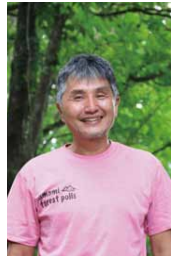
NPO 法人 TAMASU