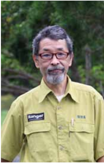
環境省奄美野生生物保護センター

阿：奄美大島の種構成というのは、奄美にしかない。世界にはいろんな動物がいますが、奄美からいなくなったら、地球上から失われてしまう生き物がたくさんいる。奄美であるからこそ、命を伝えてきている生き物たちがたくさんいて、それを温存してあげることによって、地球の多様性も保たれるのです。