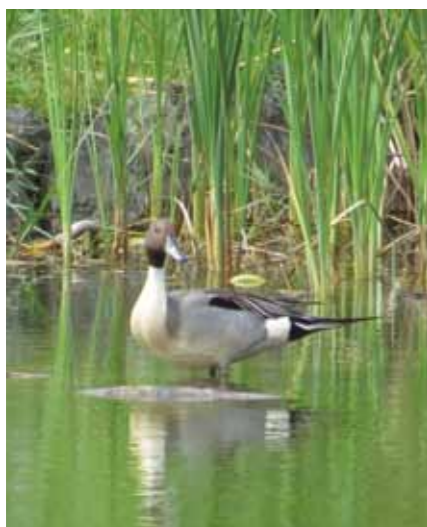
奄美野生生物保護センター前の池に訪れたオナガガモ（冬鳥）のオス。チョコレート色の頭とピンッと伸びた黒い尾羽が特徴です。

冬鳥の多くなる時期には庭が少しやかましいことや、大事な果実に傷をつけられることも多々ありますが…。温かい目で見守りながら、どんな種類がやってきているのか、観察し調べてみるのも面白いですよ。