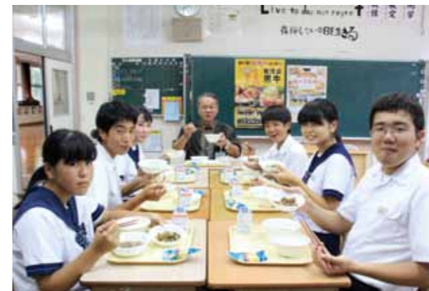
伊集院村長と一緒に