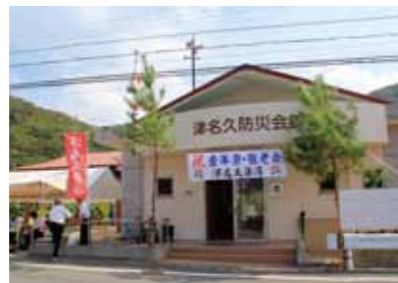
防災会館もおめかし

9月23日（日）、村内の11集落のうち、津名久、大和浜、大榎、大金久、戸円の5集落で十五夜豊年祭が開催されました（今里集落は8月に開催しています）。 豊年祭の朝は早く、津名久集落では午前6時に婦人会のメンバーが集合し、前日に下ごしらえをしていた料理の仕上げにかけ声あげながら振り出しが行われ、いよいよ豊年祭の始まりです。他集落の力士との応援相撲の対戦や、老人会や婦人会のメンバーによる余興、島唄、子どもたちのダンスなど、幅広い年齢層による余興も披露され、賑やかに開催されました。