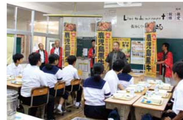
奄美で育った牛も多い