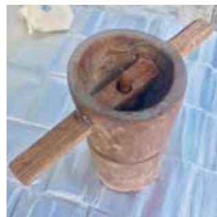
上から籾を入れて左右に回すと、脇から殻が取れた玄米が落ちてきます。感動しました。