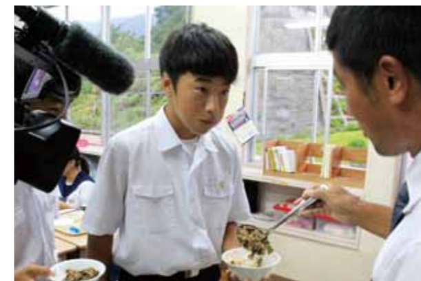
先生、おかわりください！