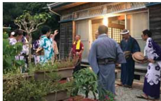
トネヤが第一会場