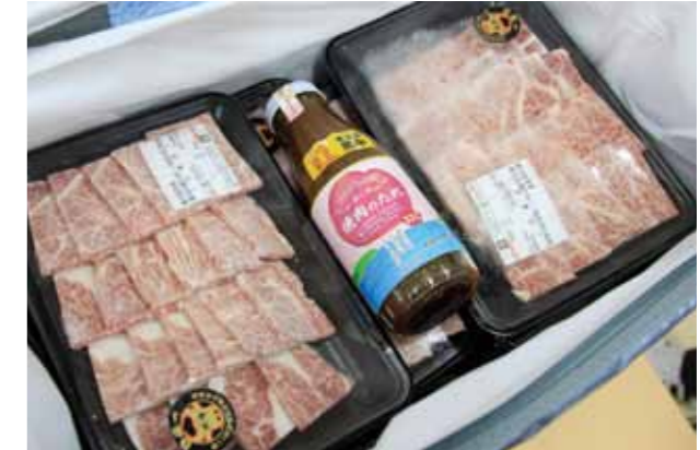
見事なサシが入っていました