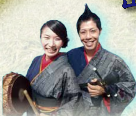
奄美島唄ユニット つむぎんちゅ