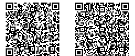
①鹿児島県 ②奄美大島5市町村