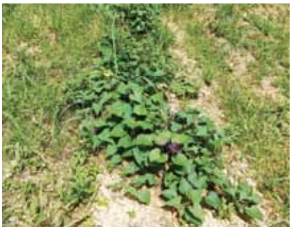
キードン楽しみです！