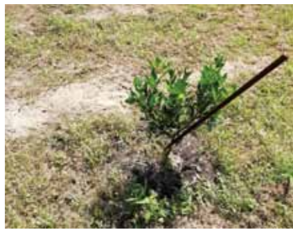
タンカンの苗木すくすく育っています！

農家サポーターでは、最近名瀬からのお客様で、大和村内の畑の草刈りをお願いして頂ける方もいらっします。いつでも農作業のご依頼お待ちしております！ 毎日忙しく、慌ただしくしていますが、畑の事なんでもご相談お待ちしております！