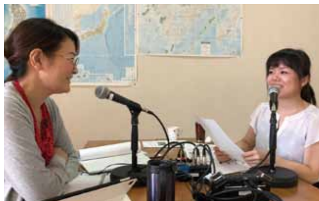
庁舎内に設置した「やまとディスタジオ」での収録の様子。慣れない収録で何度も撮り直すことも。