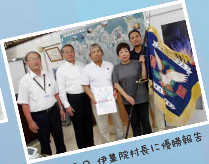
7月10日 伊集院村長に優勝報告