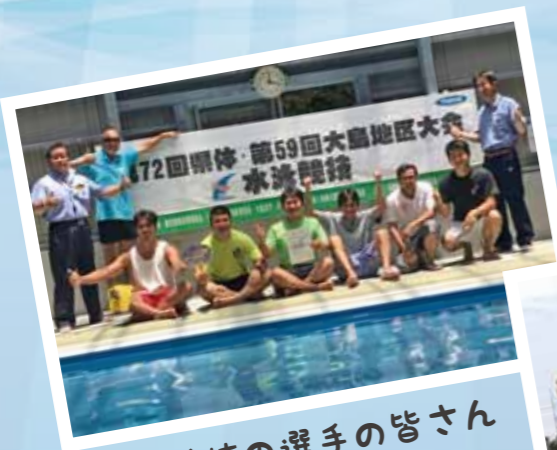
水泳競技の選手の皆さん