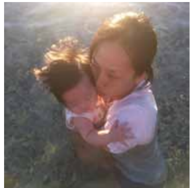
海に入ったあとはスッキリ涼しくて気持ちがいいです。