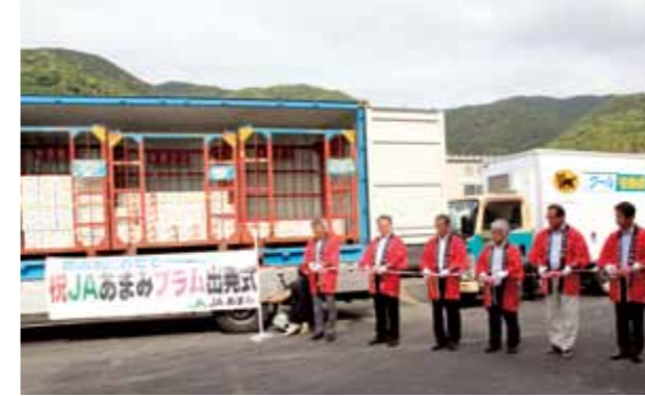
出発式でのテープカット