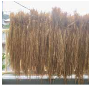
刈り取った稲を玄関先で干しています。次はもっと収穫したいです。