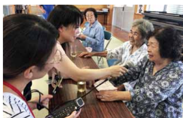
大和浜で行われたカレーサロンでのインタビューの様子。元気な高齢者の皆さんの声を聞くと、私たちも元気がわいてきます。