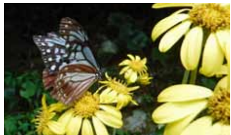
ツツブキを訪れたアサギマダラ