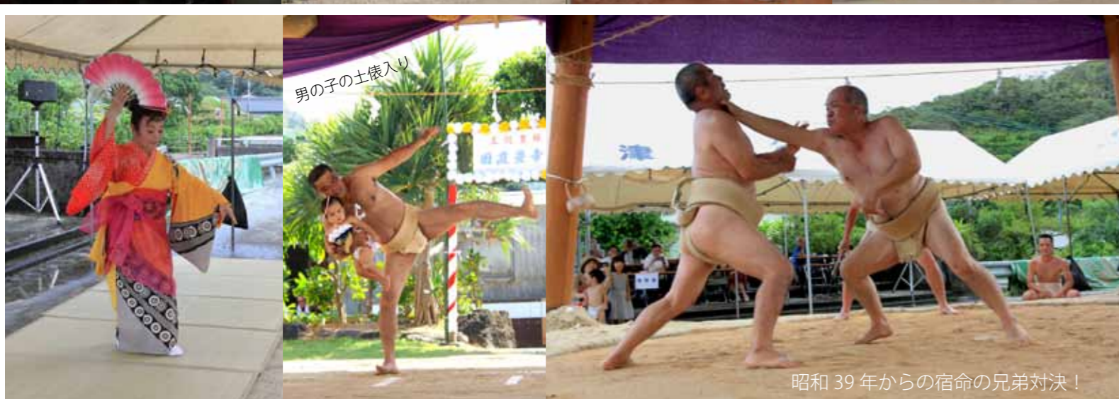
昭和39年からの宿命の兄弟対決！