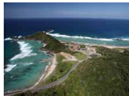
アサン崎の風景 大和村の美しい海と山を大切にしてくれるような人を募集しています！

美しい海と山に囲まれた大和村の未来が、変わらずに訪れる人も住んでいる人も笑顔でいられるように、どうぞよろしくお願い申し上げます。