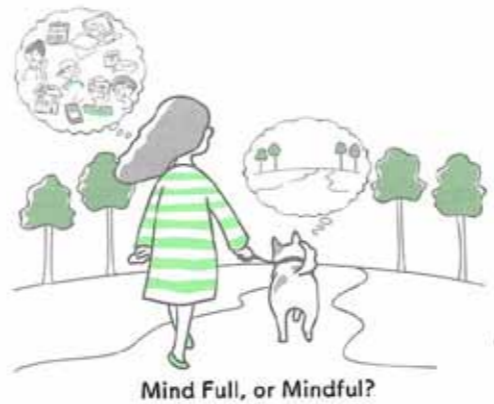
Mind Full, or Mindful?

普段から呼吸を意識した瞑想法を練習しておく、目の前で予想しなかった出来事が起こったときや心が乱れたとき、呼吸に集中するとすぐにマインドフルネスの状態へ立ち戻ることができます。もっと詳しく知りたい方は診療所へどうぞ。