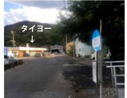
大和村に向かう場合はこちらのバス停で乗車して下さい。