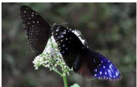
ヤマヒヨドリバナを訪れたツツムラサキマダラ