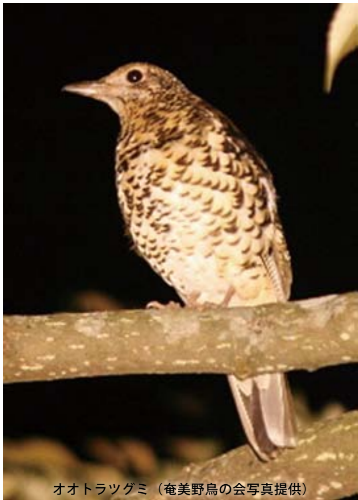
オオトラツグミ

奄美野鳥の会では、このオオトラツグミの繁殖個体数の増減を記録しておくために、1994年からさえずり一斉調査を行っており、今回で22回目の調査となります。