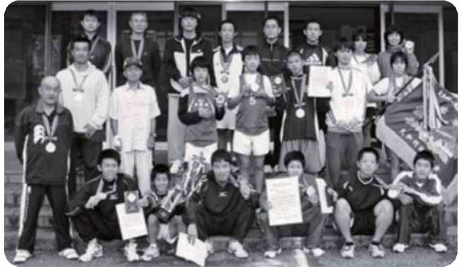
優勝 大和浜チーム