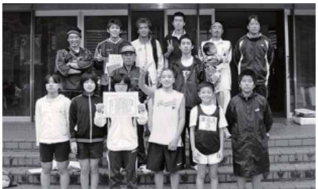
躍進賞 津名久チーム