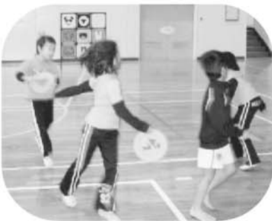
フライングストラックアウト

数あるニュースポーツの中から今回は「ヒーローディスク・ドッチビー・カップスタックス・けん玉・コマ返し」を行い、途中今回の種目ではありませんが、お手玉も始まり思わぬ名人の登場など新しい競技から懐かしい競技まで楽しく汗を流した半日となりました。