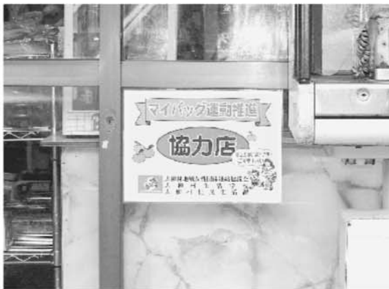
マイバッグ運動のステッカーが貼ってある村内のお店