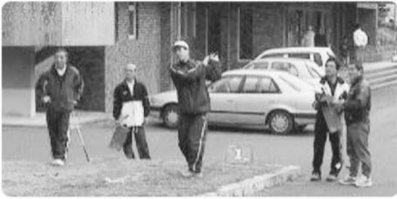
ターゲットパードゴルフ

今回は「新しいことをしよう！」と従来の種目に加え、村体育館内では「タグラグビー」、ニュースポーツ(5種目)を行いました。当日は曇り空ではありませんでしたが、天候に恵まれ、大勢の参加がありました。