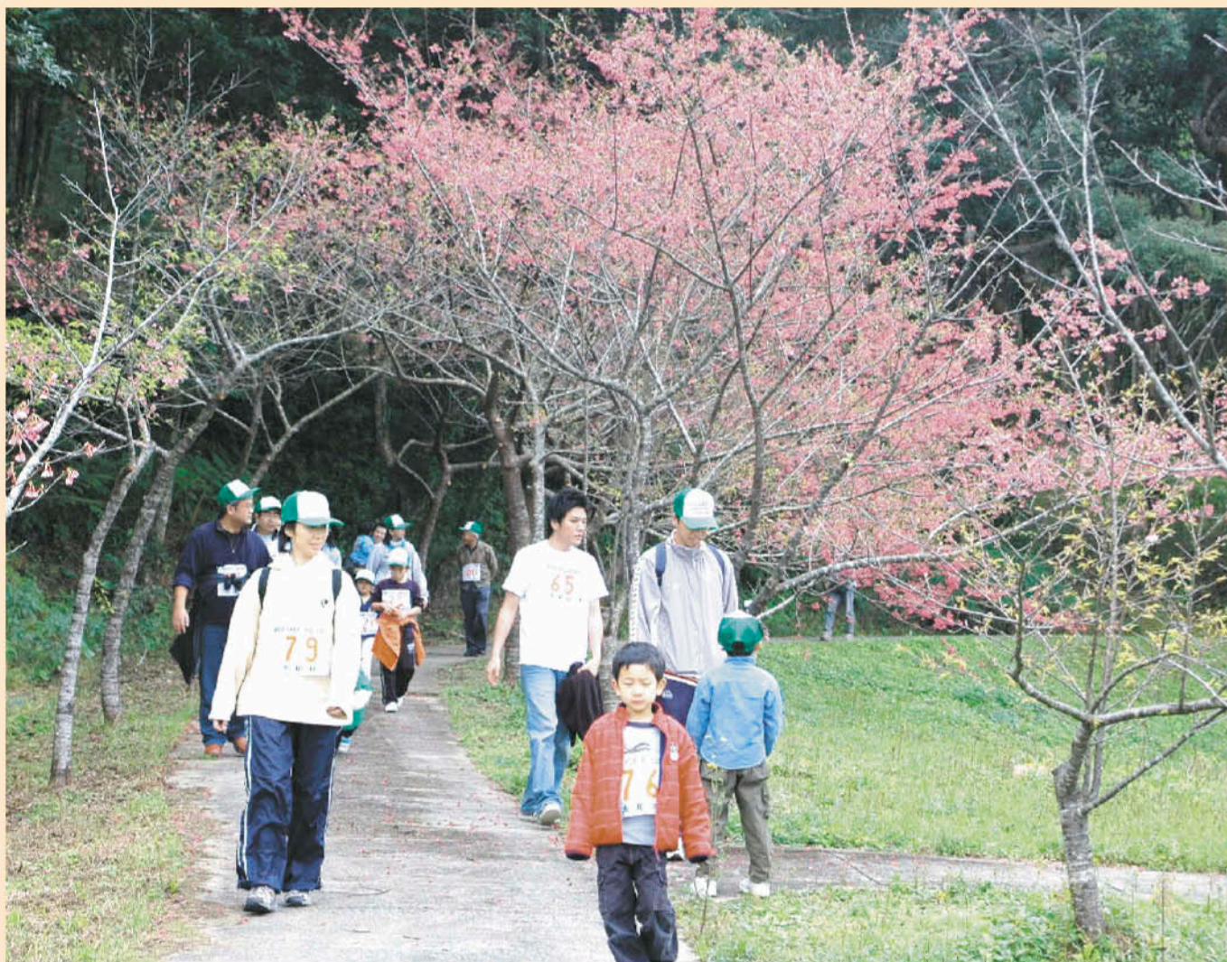
第5回 まほろば大和ウォーキング大会