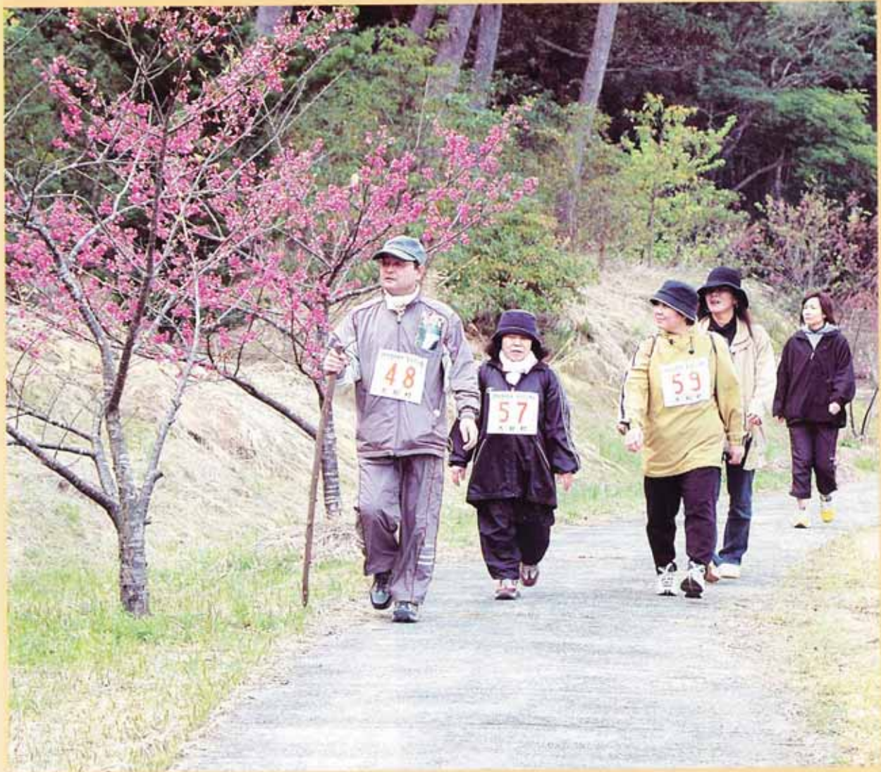
第4回 まほろば大和ウォーキング