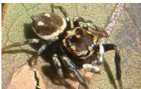
ハヤブサカノコハエトリグモ

奄美群島および沖縄諸島に分布。主に林内で、草本上や樹幹で見ることができる。八重山諸島に分布するカラオヒハエトリと別種であることが、近年明らかになった。