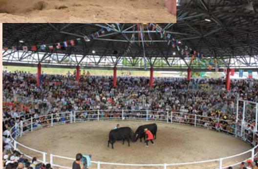
(伊仙町役場きゅらまち観光課)

また、併設されている資料展示室では闘牛の歴史などについて知ることができますので、ぜひお越しください。