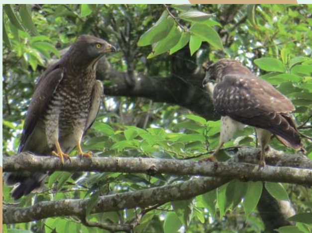
サシバ 奄美の冬の風物詩であるサシバ。ピックイーと鳴きながら、縄張りを主張する。観察していると面白い行動を見ることができる。