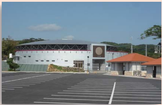
▲徳之島なくさみ館

闘牛の歴史はおよそ300年前の島唄にも残されており、古くから徳之島の人々に愛されてきました。