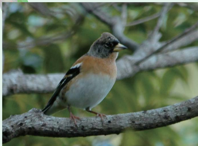
アトリ 冬鳥として全国に渡来する。平地や山地、農耕地で見ることができる。地上付近で草の種などを食べる。