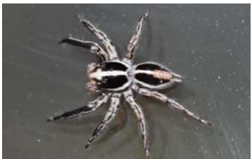
▲オス おなかのところに黒い帯が2本ある。