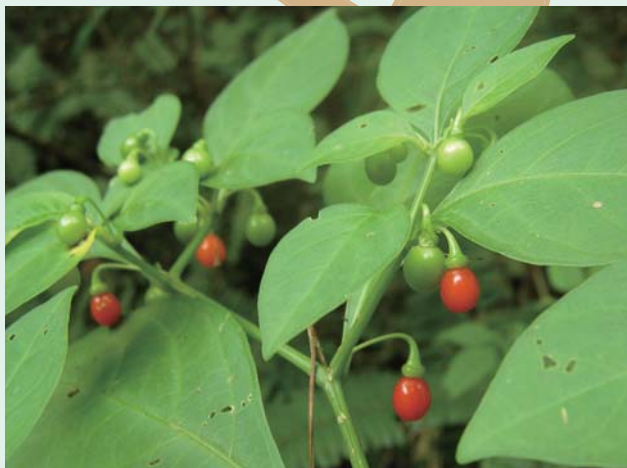
マルバハダカホオズキ 九州南部から琉球に分布。やや湿った林縁に生える多年生。葉は互生し、葉身は卵形。果実は球形で赤く熟して目立つ。