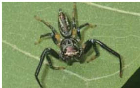
マスラオハエトリグモ

奄美大島から宮古島に分布する。草地や森林の草や木の上で見られる。黒い体に青緑色の光沢のある毛が生える。