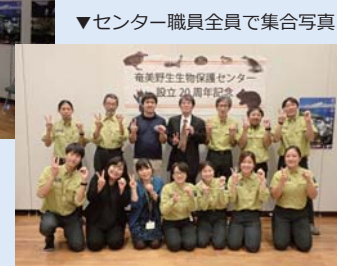
▼ センター職員全員で集合写真