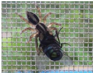
▲ハエを捕まえるチャスジハエトリグモ

家の中でも見ることができるとても身近なハエトリグモ。ぴよんぴよんと飛びながら移動し、ハエなどを捕まえます。