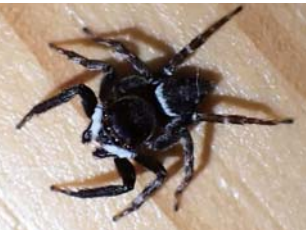
▲オス 白い触肢が目立つ。