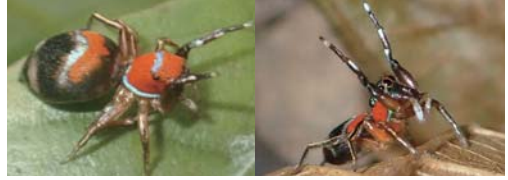
アカオヒハエトリグモ（メス）

奄美大島から宮古島に分布する。草地や森林の草や木の上で見られる。黒い体に青緑色の光沢のある毛が生える。