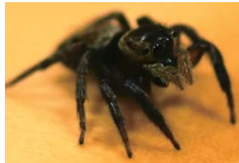
▲メス オスと違い、全体的に茶色で地味な色合い。