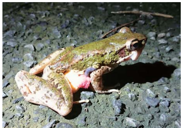
▲ロードキルにあったアマミハナサキガエル。お腹から卵が出てしまっている。