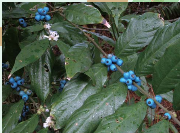
リュウキュウルリミノキ 屋久島から琉球列島に分布する。山地の林内に生える常緑低木。奄美群島では5種類のルリミノキの仲間が自生する。