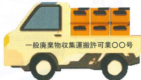
2. 許可業者に依頼する