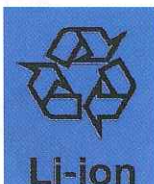
Li-ion リチウム イオン電池