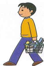
1. 自分で 持ち込む