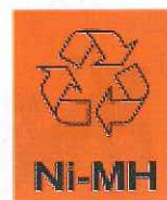
Ni-MH ニッケル 水素電池

※ボタン電池や上記のマークがついている充電式電池は 名瀬クリーンセンターで処理ができません