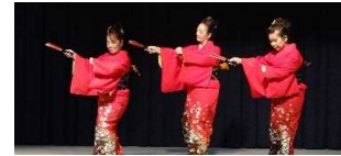
昨年の舞台発表の様子