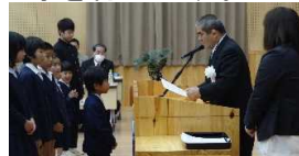
昨年の閉講式の様子

平成30年2月25日(日)13時30分より平成29年度公民館講座の閉講式を大和村防災センターで開催いたします。各講座の舞台発表、作品展示等を行います。