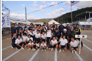
第3位と奮闘した今里チーム