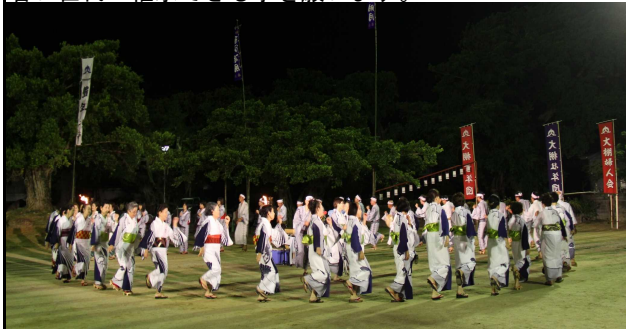
八月踊り撮影時の風景

八月踊り（大和集落）映像記録保存事業の収録が9月15日に行われました。映像記録保存事業実施にあたり、大和集落では、この収録を目標に、週に数回の練習を行い、大和小学校校庭にて無事収録を終えました。八月踊りの特徴とし、必ず「足なれ」から始まります。これは、発声練習と踊りの準備運動。最初はゆっくりとしたリズムから始まり、徐々にチヂン（太鼓）が大きく早くなります。そして唄の終わりには、「唄かわせ」が入ります。内容は、男女のどちらかが「唄を変えましょう、次の唄を唄いましょう」と合図を送るのです。そして、大和集落の場合「あらしゃげ」に入ります。これは、決まった流れの歌詞があり、テンポが一層早く、唄い手とチヂンの意地の張り合いで、リズムと唄のどちらかが出なくなった時、1曲が終了となり、ドオツと笑いと拍手が起きます。唄の最後に、整理運動の唄もあります。歌詞の意味や踊りの特徴を知る事や月明かりで行われた情景を考えると、先人はすごいロマンチストで素晴らしい文化を考えたと思います。このような文化を継承させるべく大和集落の映像保存に携わった大和八月踊り保存会を始めとする集落の方々、お疲れ様でした。これを機に若い世代へ継承できる事を願います。