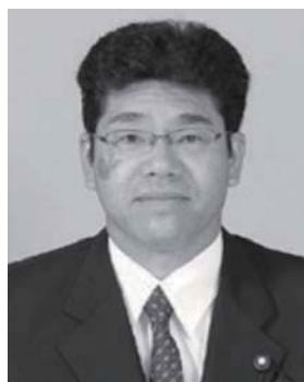
議 長 今 井 秀 樹