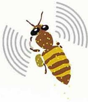
②花ふんがはこばれる