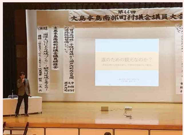
3町村の観光振興に欠かせない盛りだくさんの内容でした!